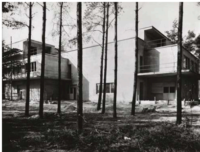
Lucia Moholy, aus der Siedlung der Bauhausmeister: Doppelhaus (im Bau) Südseite, Architekt: Walter Gropius, Silbergelatineabzug, 1926 © Lucia Moholy / VG-Bild Kunst, Bonn 2019