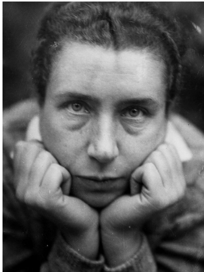
Selbstporträt Lucia Moholy, 1930 Bauhaus-Archiv Berlin, Inv.nr. 10712 © VG Bild-Kunst, Bonn 2015